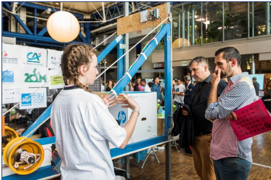
Engagement P ontaudmérien pour un U sage de la R isle E co-responsible